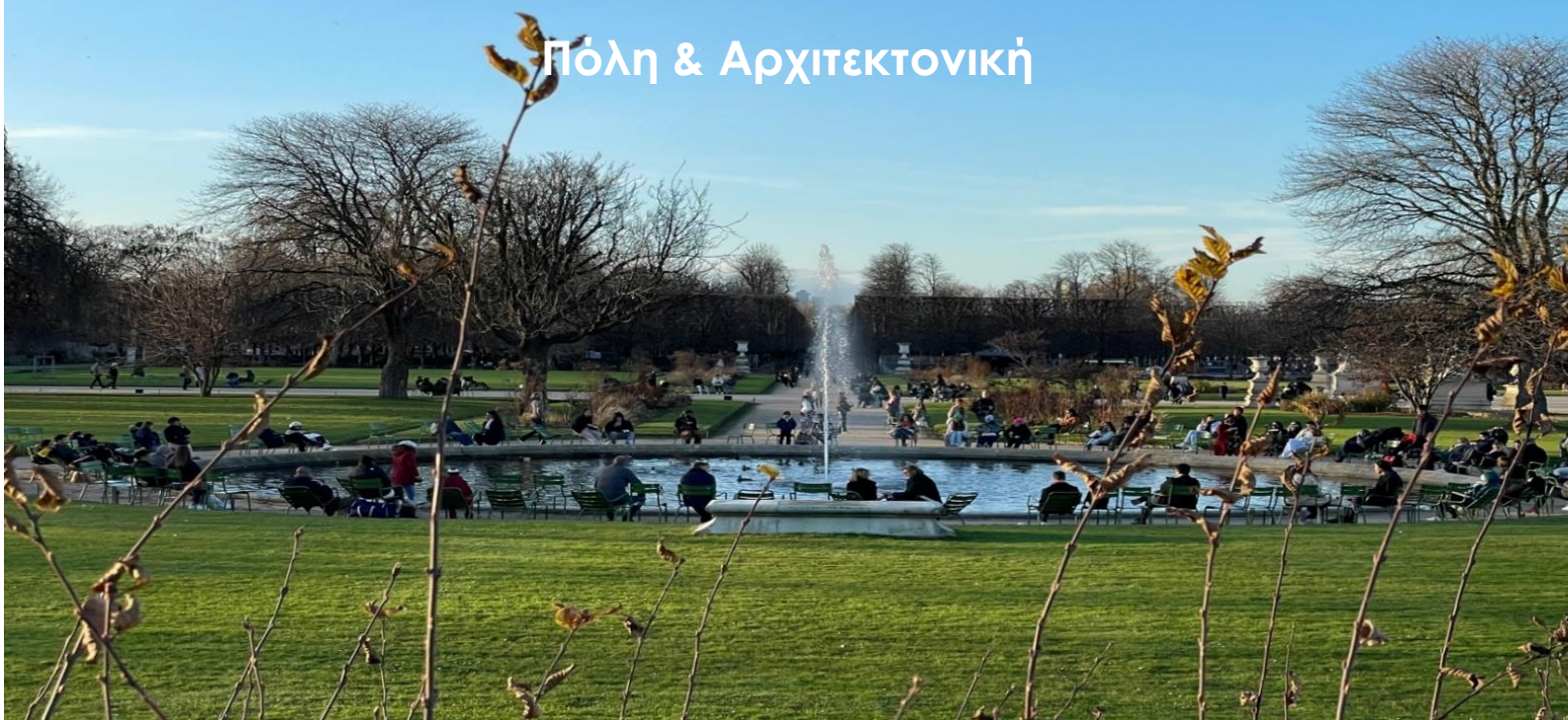
Jardin des Tuileries, Paris, Décembre 2022