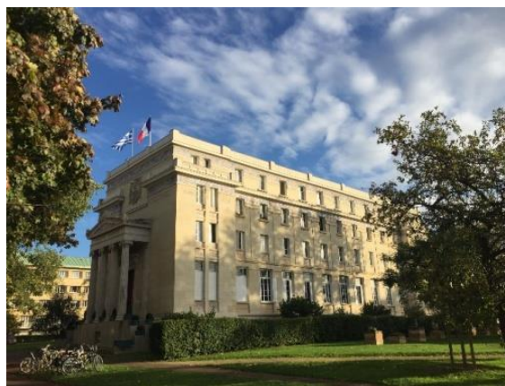
ΤΟ ΕΛΛΗΝΙΚΟ 'ΣΠΙΤΙ'