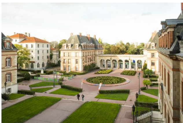
Le campus de la Cité Universitaire

Son bâtiment, œuvre de l'architecte Nicolas Zahos, construit pendant l'entre-deux-guerres combine un style néoclassique avec des références Art Déco été entièrement restauré en 2021.