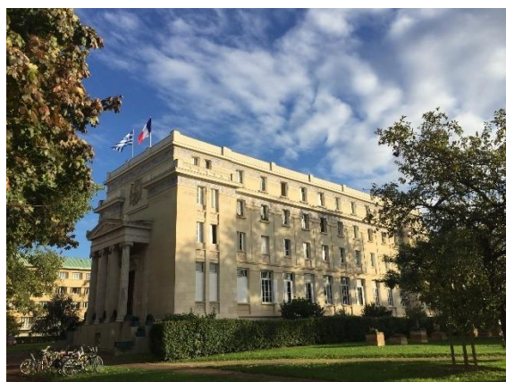
La Fondation hellénique