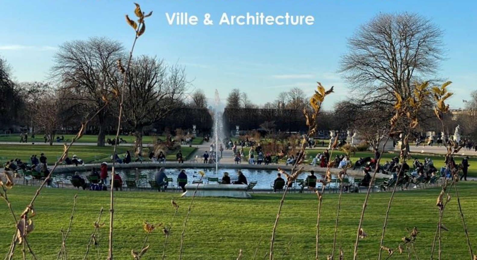
Jardin des Tuileries, Paris, Décembre 2022